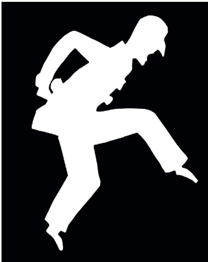
Силуэт Пьеро, вырезанный Гансом Христианом Андерсеном из бумаги.

Ганс Христиан Андерсен любил иллюстрировать свои сказки силуэтами или теневыми картинками или картинками, вырезанными из бумаги.