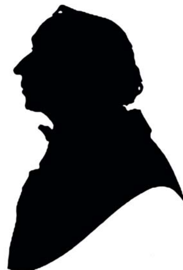
Силуэтный портрет Ганса Христиана Андерсена.

Сделай фото своего друга на светлом фоне так, чтобы он стоял боком на выбранном фоне. Распечатай фото на принтере (желательно не во всю величину листа, а поменьше) и скопируй контур профиля против света (например, используя оконное стекло) на цветную бумагу. Вырежи по контуру профиль и наклеи на белую бумагу. Вот и готов портрет!